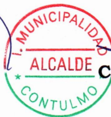
CARLOS LEAL NEIRA ALCALDE